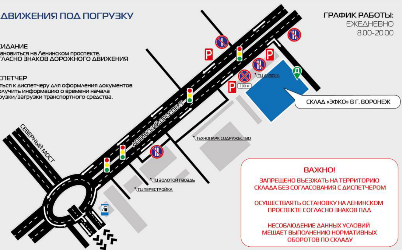
ГРАФИК РАБОТЫ: ЕЖЕДНЕВНО 8.00-20.00

Д ДИСПЕТЧЕР Явиться к диспетчеру для оформления документов и получить информацию о времени начала выгрузки/загрузки транспортного средства.